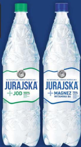
Jurajska z Jodem 1,5l Jurajska z Magnezem 1,5l