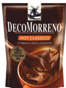
DecoMorreno napój czekoladowy Classic z pianką 150g torba