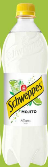
Schweppes Mojito 0,85l