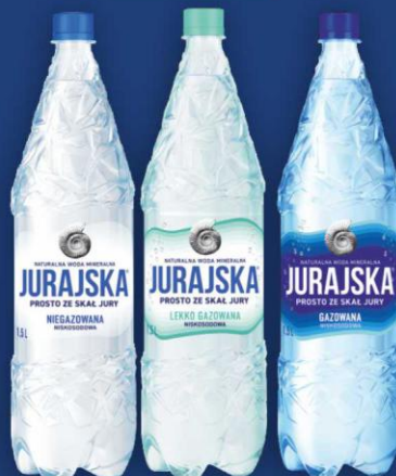
Naturalna Woda Mineralna Jurajska 1,5l niegazowana/lekko gazowana/gazowana