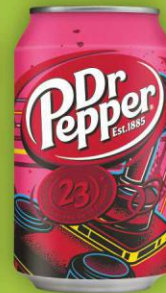
Dr Pepper puszka 0,33l