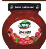
Łowicz Żurawina do mięs i serów 230g