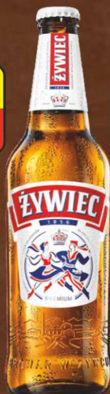
Żywiec TP 0,5l butelka zwrotna

Cena promocyjna przy zakupie min. 5 skrzynek