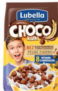
Lubella płatki Choco Kulki 250g