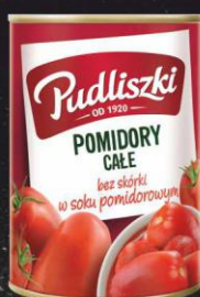
Pudliszki pomidory całe 400g puszka