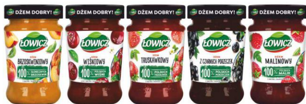
Łowicz Dżem 280g BRZOSKWINIOWY, WIŚNIOWY, TRUSKAWKOWY, Z CZARNYCH PORZECZEK, MALINOWY