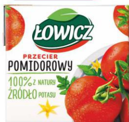
Łowicz PRZECIER POMIDOROWY karton 500g