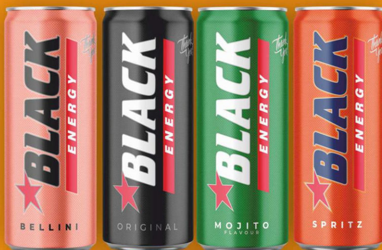
BELLINI, ORIGINAL, MOJITO, SPRITZ