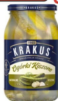
Krakus Ogórki Kiszone 860ml