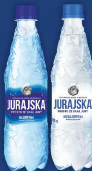
Naturalna Woda Mineralna Jurajska 0,5l gazowana, niegazowana