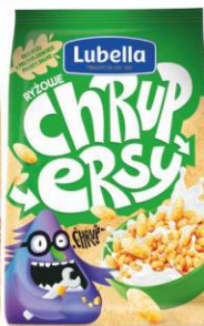
Lubella CHRUPERSY Ryżowe 200g