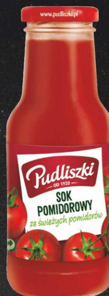
Pudliszki 290 ml sok pomidorowy