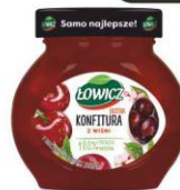
Łowicz Konfitura Z WIŚNI 240g