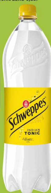
Schweppes Tonic 1,35l