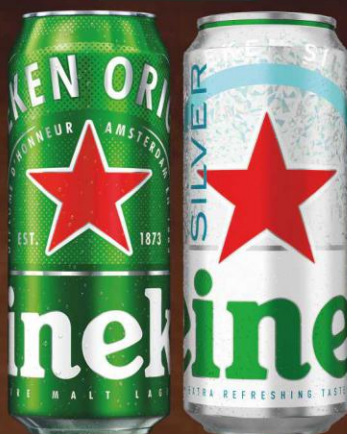
Heineken Original, Silver puszka 0,5l

Cena promocyjna przy zakupie min. 5 zgrzewek