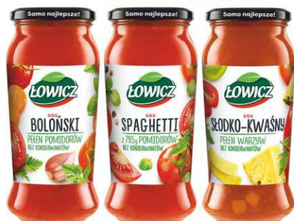
Łowicz Sos 500g BOŁOŃSKI, SPAGHETTI, SŁODKO-KWAŚNY