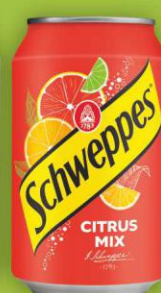
Schweppes Citrus Mix puszka 0,33l