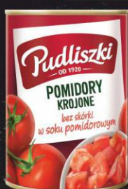
Pudliszki pomidory krojone 400g puszka