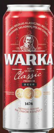
Warka JP 0,5l puszka

Cena promocyjna przy zakupie min. 3 zgrzewek