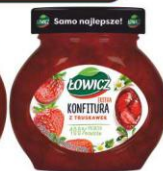
Łowicz Konfitura Z TRUSKAWEK 240g