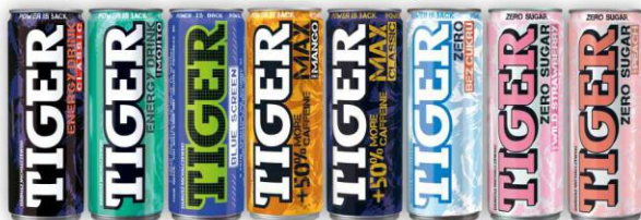
Tiger 0,25l puszka asortyment