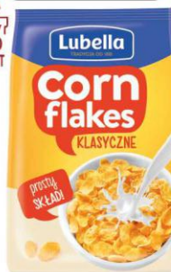
Lubella płatki Corn flakes 250g