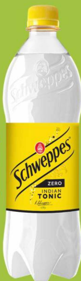
Schweppes Tonic ZERO 0,85l