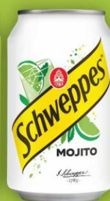
Schweppes Mojito puszka 0,33l