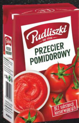
Pudliszki przecier pomidorowy 500g