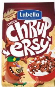
Lubella CHOCO Ryżowe 200g