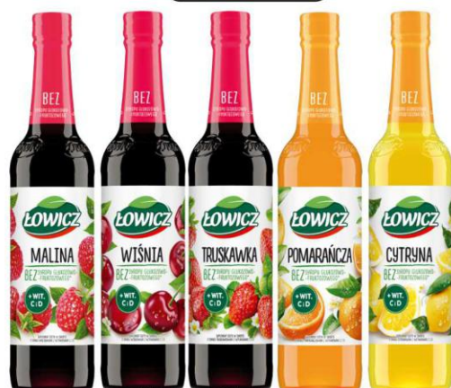
Łowicz Syrop owocowy 400ml MALINA, WIŚNIA, TRUSKAWKA, POMARAŃCZA, CYTRYNA