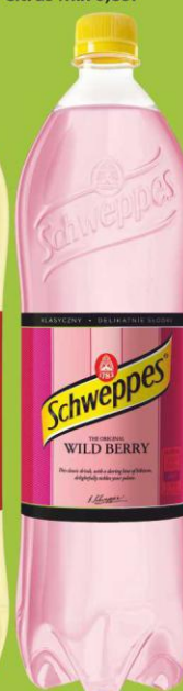
Schweppes Wild Berry 1,35l