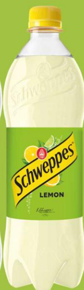
Schweppes Lemon 0,85l