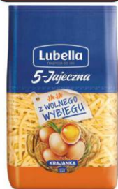
Lubella makaron 5-jajeczny 400g KRAJANKA