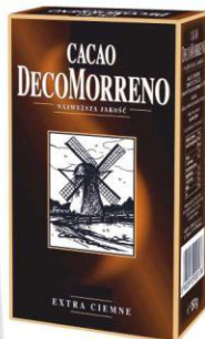
DecoMorreno Kakao Classic 150g karton