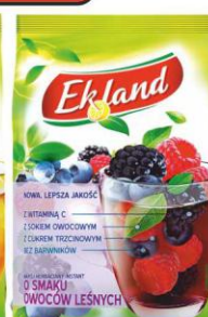
EKLAND Herbata 300g torba CYTRYNOWA, OWOCE LEŚNE