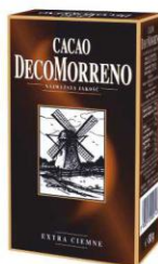
DecoMorreno Kakao Classic 80g karton