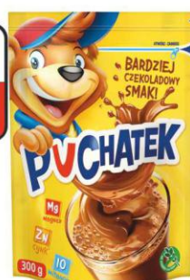
PUCHATEK napój kakao 300g torba