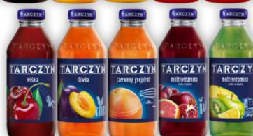
Tarczyn 0,3l szkło asortyment