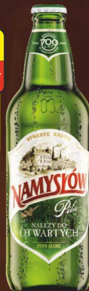
Namysłów Pils 0,5l butelka bezzwrotna

Cena promocyjna przy zakupie min. 5 skrzynek