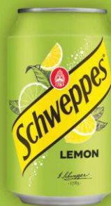
Schweppes Lemon puszka 0,33l