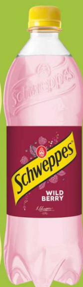
Schweppes Wild Berry 0,85l