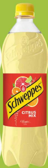
Schweppes Citrus Mix 0,85l