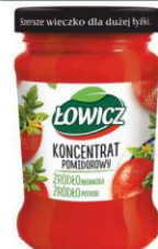
Łowicz KONCENTRAT POMIDOROWY słoik 190g