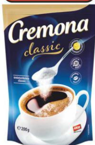
CREMONA Classic zabielaacz 200g torba