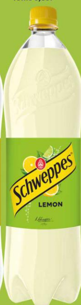
Schweppes Lemon 1,35l