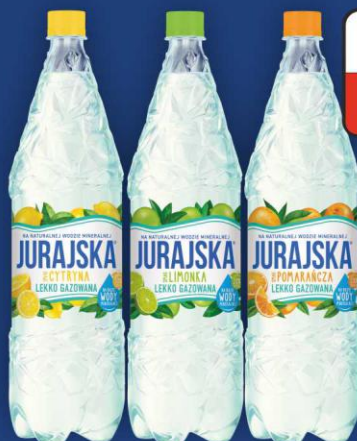
Jurajska ze smakiem 1,5l lekko gazowana asortyment