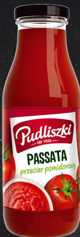
Pudliszki Passata 500g butelka