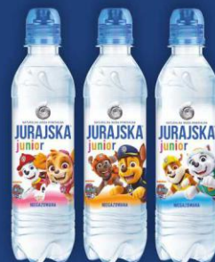
Jurajska PSI PATROL 0,33l niegazowana