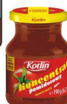
Kotlin Koncentrat pomidorowy słoik 190g