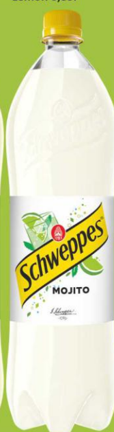
Schweppes Mojito 1,35l