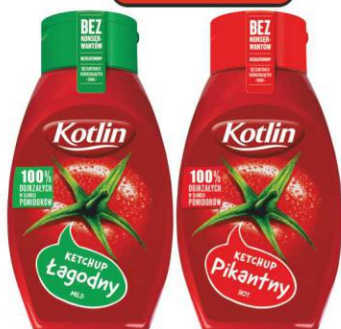
Kotlin Ketchup 450g ŁAGODNY, PIKANTNY