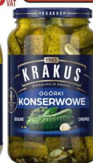
Krakus Ogórki Konserwowe 920ml