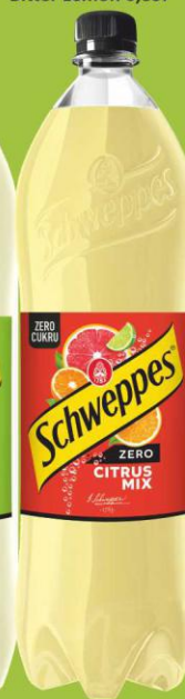
Schweppes Citrus Mix Zero 1,35l