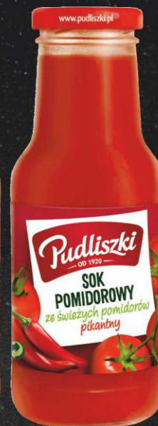
Pudliszki 290 ml sok pomidorowy pikantny