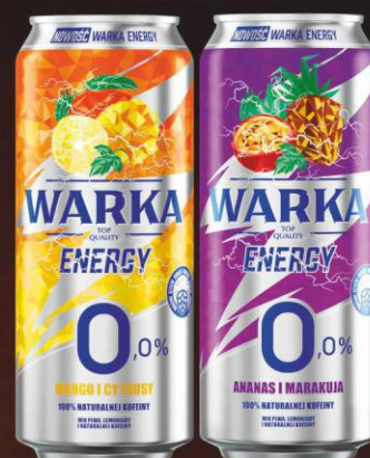
Warka Energy 0,0% Mango i Cytrusy puszka 0,5l