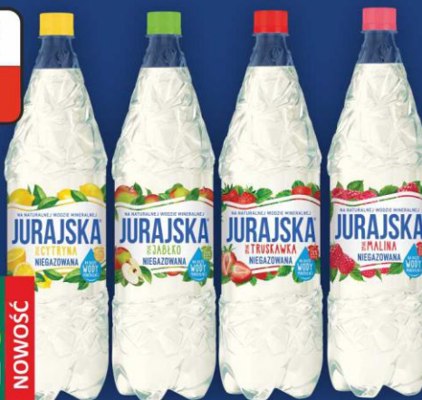
Jurajska ze smakiem 1,5l niegazowana asortyment