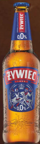
Żywiec 0,0% 0,5l butelka zwrotna