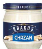
Krakus Chrzan 180g