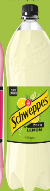
Schweppes Lemon Zero 1,35l