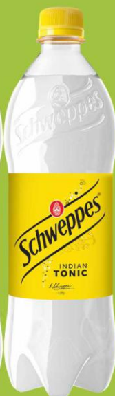
Schweppes Tonic 0,85l