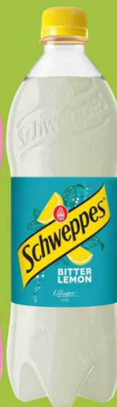
Schweppes Bitter Lemon 0,85l