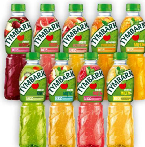
Tymbark Aseptic 0,5l asortyment