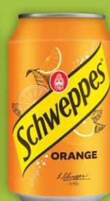
Schweppes Orange puszka 0,33l