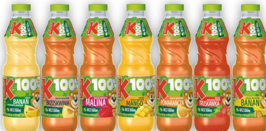
Kubuś 0,85l butelka asortyment