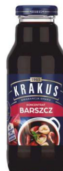
Krakus Koncentrat BARSZCZ CZERWONY butelka 300 ml