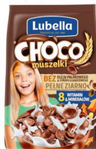
Lubella płatki Choco Muszelki 250g