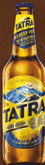
Tatra Jasne Pełne 0,5l butelka zwrotna

Cena promocyjna przy zakupie min. 10 skrzynek