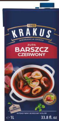
Krakus Zupa BARSZCZ CZERWONY karton 1l