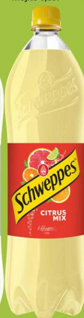
Schweppes Citrus Mix 1,35l