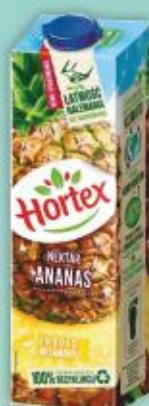
Nektar Hortex 1l ananas