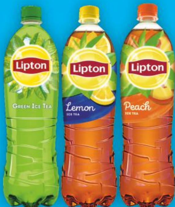
Lipton 1,5l butelka asortyment