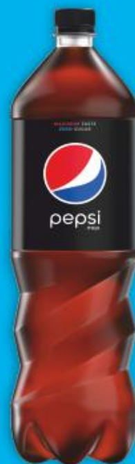
Pepsi Max 1,5l butelka