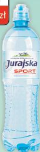
Naturalna Woda Mineralna Jurajska 0,75l SPORT niegazowana