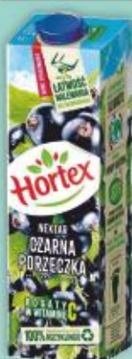
Nektar Hortex 1l czarna porzeczka