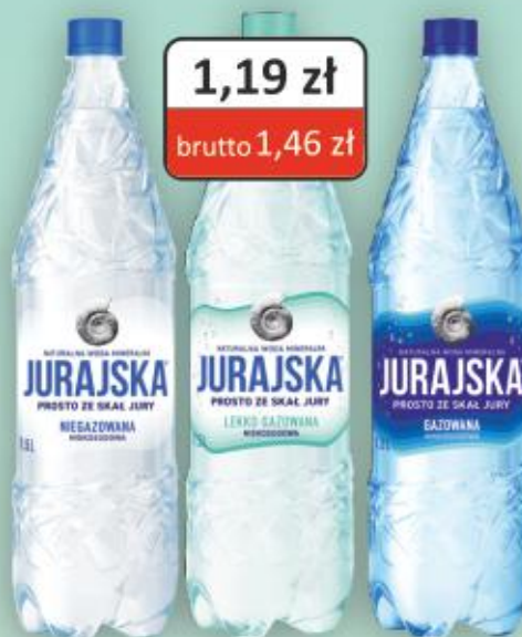
Naturalna Woda Mineralna Jurajska 1,5l niegazowana/lekko gazowana/gazowana