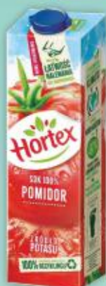
Sok Hortex 1l pomidor