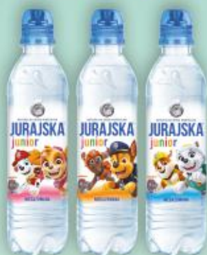
Jurajska PSI PATROL 0,33l niegazowana