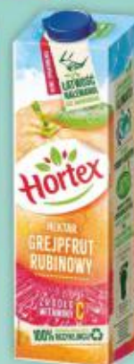
Nektar Hortex 1l grejfrut rubinowy