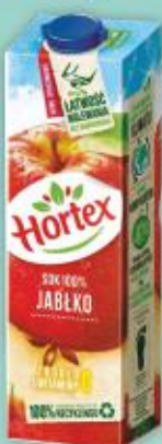
Sok Hortex 1l jabłko