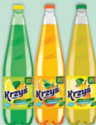
Krzys 1,25l gazowany asortyment