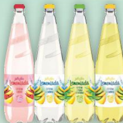
Jurajska Lemoniada 1,25l gazowana asortyment