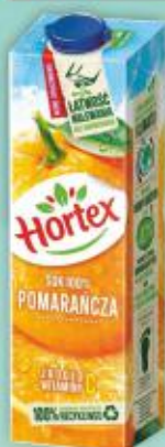
Sok Hortex 1l pomarańcza